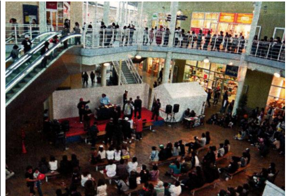
ステージ写真 (イベント実施例)